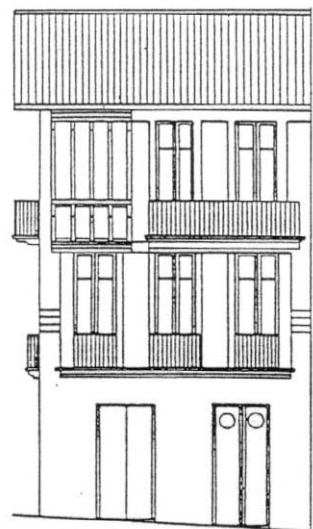
HERRIKO ENPARANTZA Nº 12