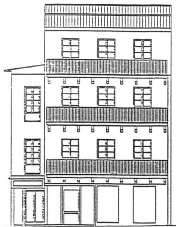
PLAZA DE LOS FUEROS