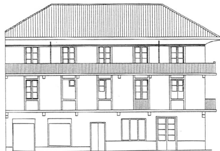
C./ SANCHOENEA Nº 31