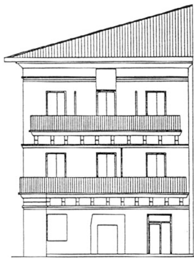
C./SANTA CLARA Nº 01