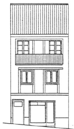
C./ ARRIBA Nº 22