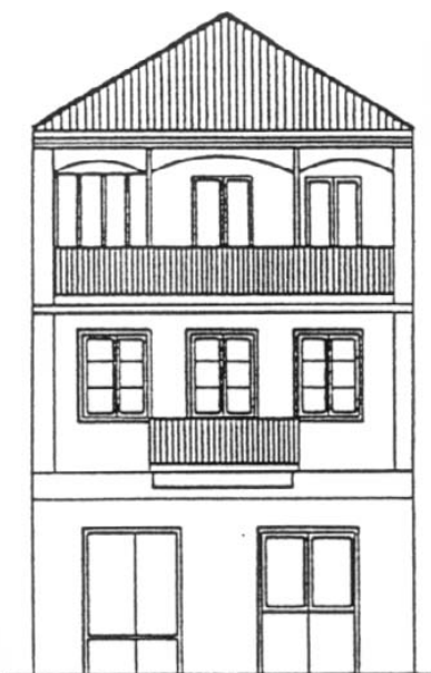
C./ MAGDALENA Nº 18