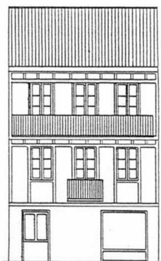
C./ MAGDALENA Nº 36